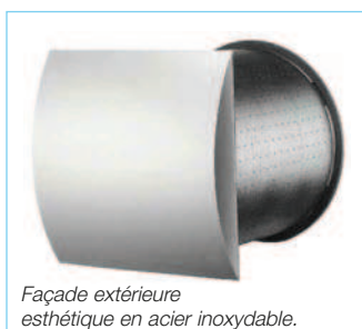
Façade extérieure esthétique en acier inoxydable.